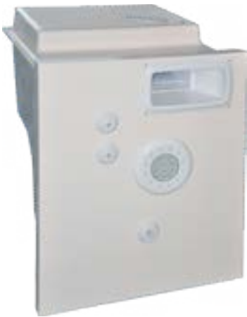
VERSIONE IKARUS / IKARUS VERSION