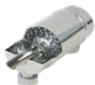
scambiatore in titanio