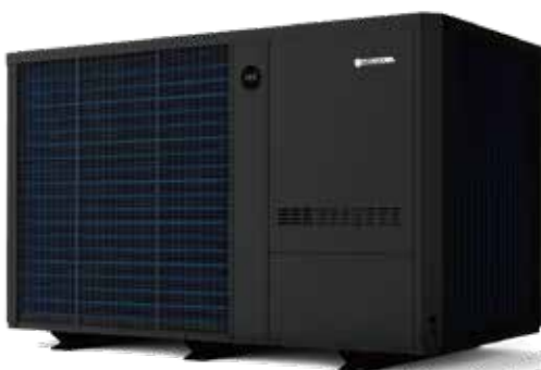
Indiana Inverter Invermax