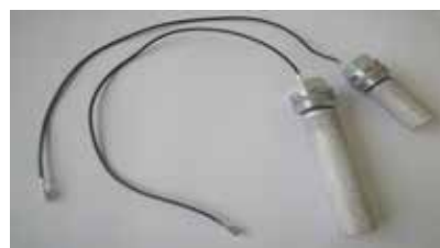
Le caratteristiche prestazionali del generatore MineralChlor™