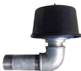
Filtro in aspirazione Suction filtre

ACCESSORI PER BLOWERS IN ALLUMINIO - FILTRI IN ASPIRAZIONE, SILENZIATORI ACCESSORIES FOR ALUMINUM BLOWERS - SUCTION FILTERS, SILENCERS