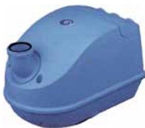
BLOWER funzionamento alternato

SOFFIANTE A FUNZIONAMENTO ALTERNATO PER SPA IN MURATURA FOR MASONRY SPA BLOWERS IN ALTERNATING OPERATION