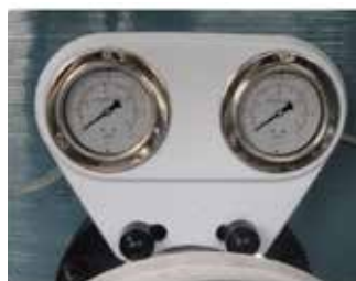
Cod. 1080110 Piastra a due manometri Plate with two pressure gauges