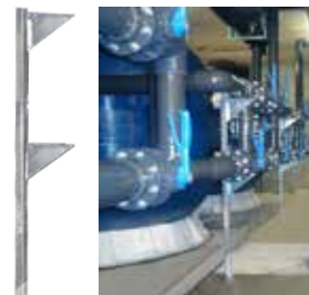
Cod. 1080104 Supporto regolabile Adjustable support