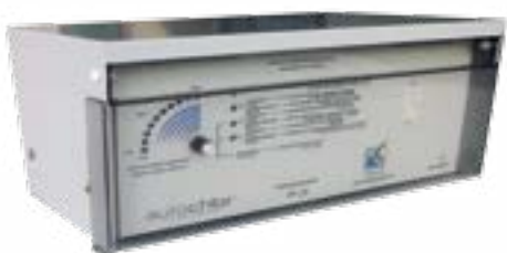
Modello RP PH-20