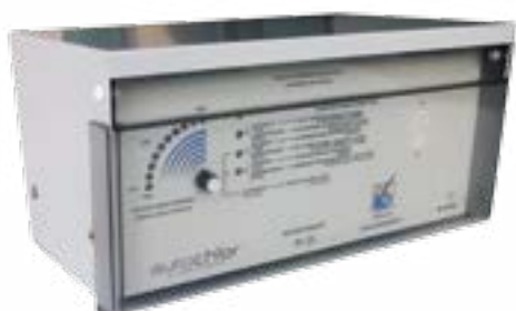
Modello RP PH-20