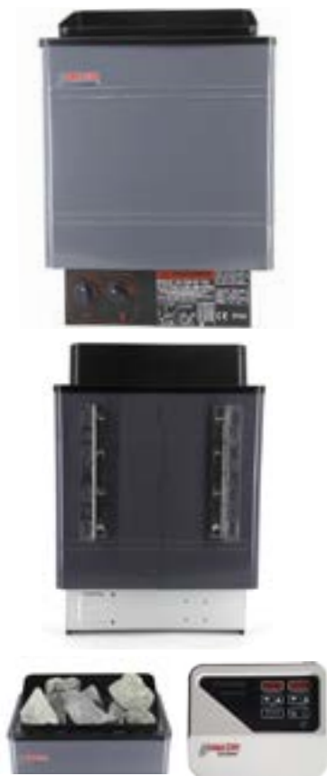
Controller solo per cod. 5020371 - 5020372 Display controller on cod. 5020371 - 5020372