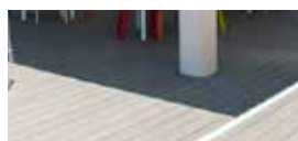
Decowood Grigio Pietra Decowood Light Grey