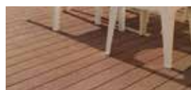
Decowood Marrone Tropical Decowood Brown Tropical