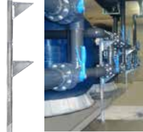
Cod. 1080104 Supporto regolabile Adjustable support