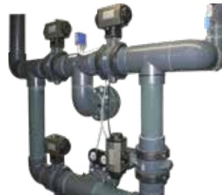
Batteria ad azionamento pneumatico Batteries with pneumatically operation