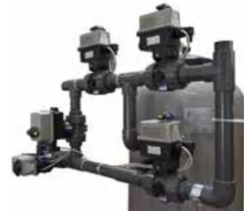
Batteria controlavaggio elettro attuata Electric actuated Backwash battery