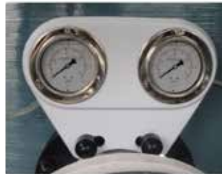
Cod. 1080110 Piastra a due manometri Plate with two pressure gauges