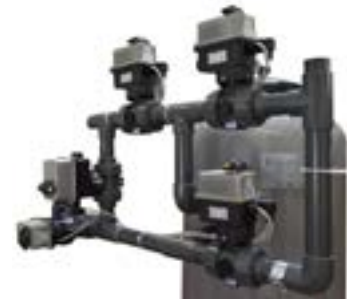
Batteria controlavaggio elettro attuata Electric actuated Backwash battery