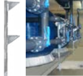
Cod. 1080104 Supporto regolabile Adjustable support