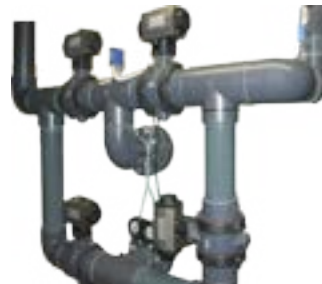
Batteria ad azionamento pneumatico Batteries with pneumatically operation