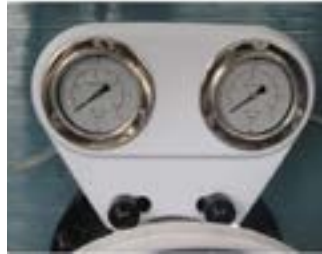
Cod. 1080110 Piastra a due manometri Plate with two pressure gauges