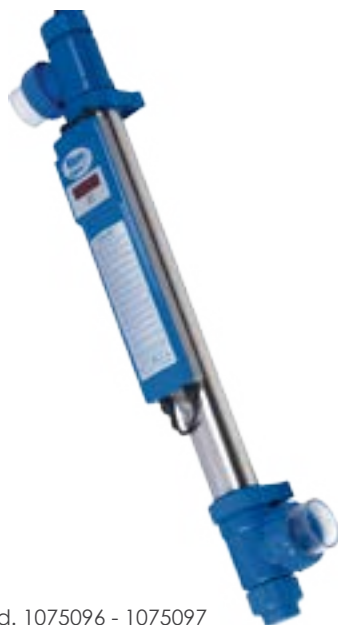
Cod. 1075096 - 1075097