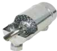
scambiatore in titanio