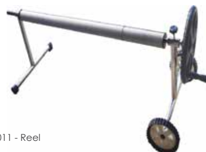
Cod. 1060011 - Reel