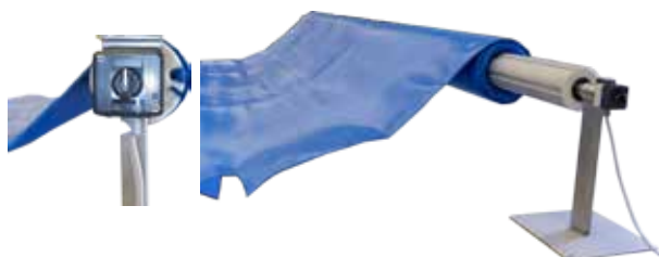
Cod. 1060012 - Arione

ARIONE: anodized aluminum roller, diameter 14, 304 stainless steel supports full of white Derlin material head for fixing the aluminum tubes and stainless steel to lock the crank. Crank coated in black plastic, feet covered with white plastic and wheels coated in black rubber. Motorization optional, includes motor CC 24 V, control selector switch, electrical panel, cable 6 meters.