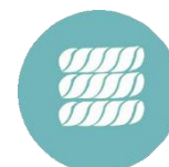
Scambiatore di calore spirale in titanio