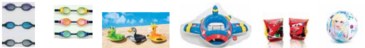
cod. 8010080 cod. 8010081 cod. 8010084 cod. 8010093 cod. 8010101 cod. 8010109