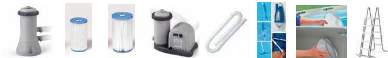
cod. 8010031 cod. 8010036 cod. 8010037 cod. 8010038 cod. 8010051 cod. 8010066 cod. 8020022 cod. 8020022