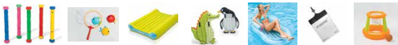
cod. 8010124 cod. 8010125 cod. 8010135 cod. 8010136 cod. 8010137 cod. 8010153 cod. 8010110